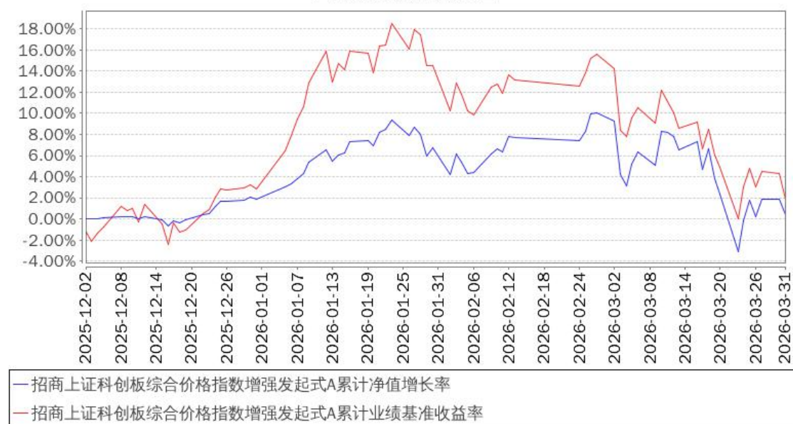
招商上证科创板综合价格指数增强发起式A累计净值增长率与同期业绩比较基准收益率的历史走势对比图